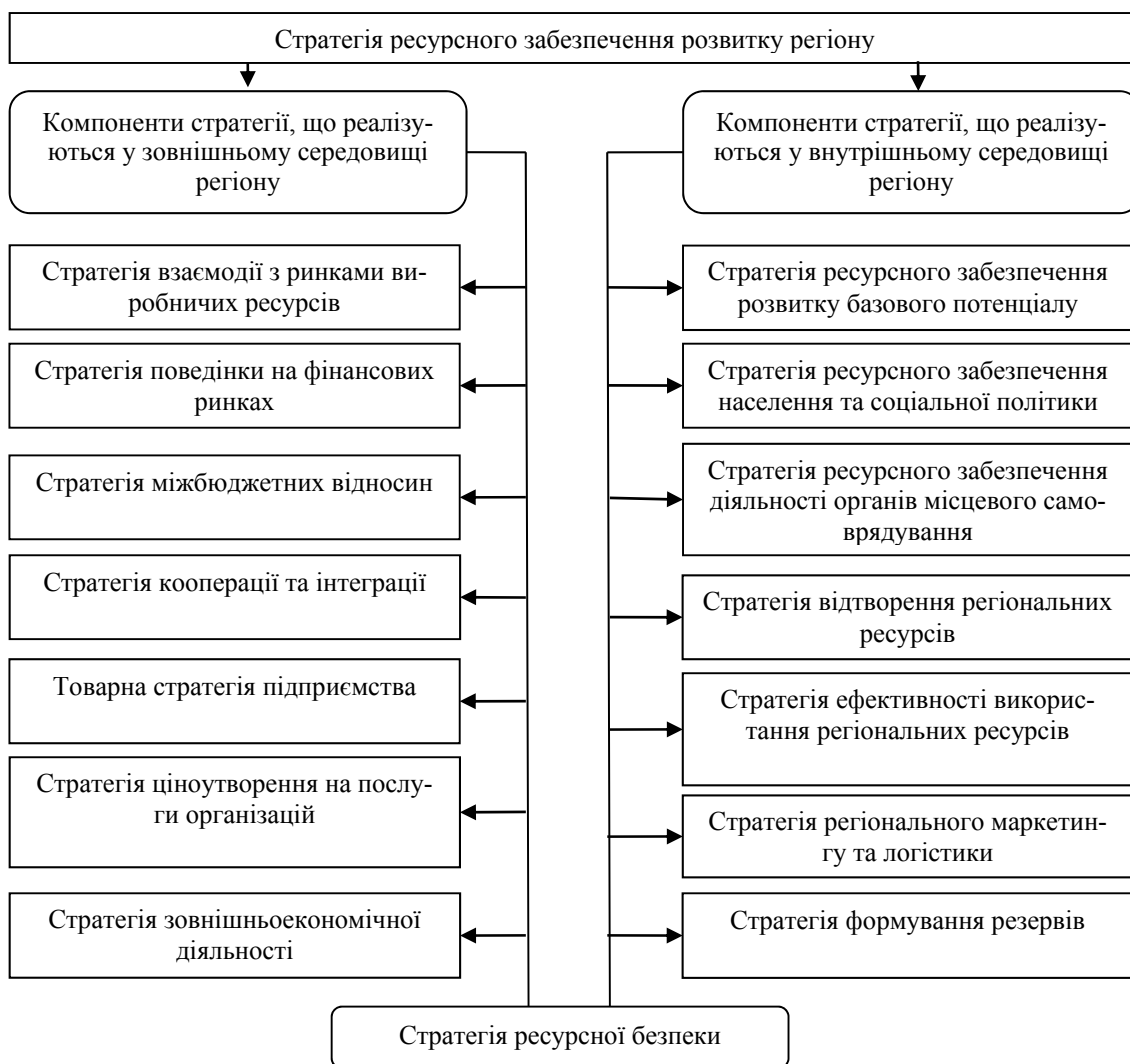
Рис. 1. Компонентна структура стратегії ресурсного забезпечення економічної безпеки і стійкого розвитку регіону

Цикл розробки стратегії ресурсного забезпечення розвитку регіону включає кілька взаємопов'язаних дій: